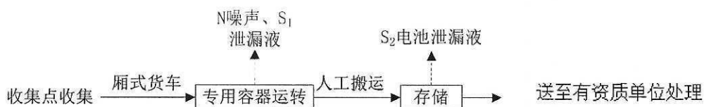
图 5-1 工艺流程图